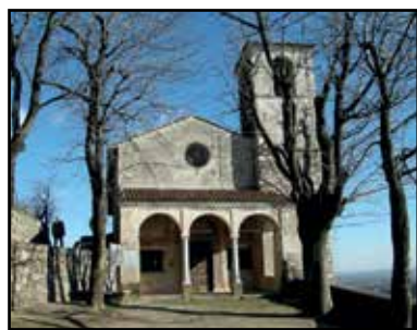
La chiesa di San Bernardo.