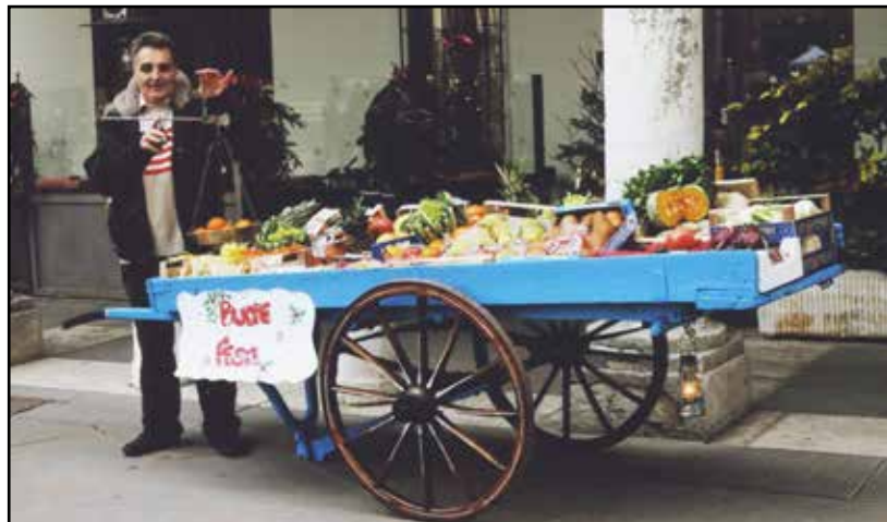
Popy in piazza con la storica "carretta" e la bilancia d'altri tempi.