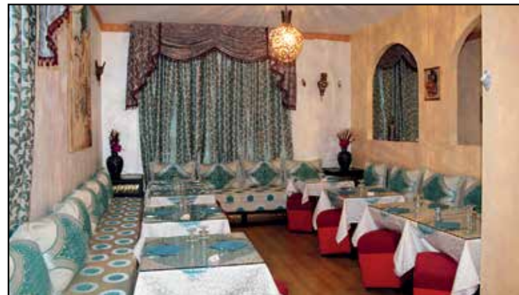
NUOVA SALA RINNOVATA PER APPUNTAMENTI

MENU' ALLA CARTA PIATTI DELLA CUCINA SIRIANA VINO BIANCO-ROSSO-BIRRA-GRAPPA SIRIANI