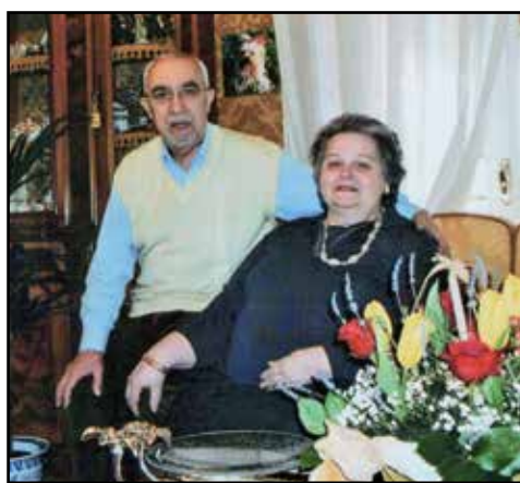
I coniugi Sisti.

Mille auguri di ogni serenità e bene da parte dei parenti e della direzione dell'Eco.