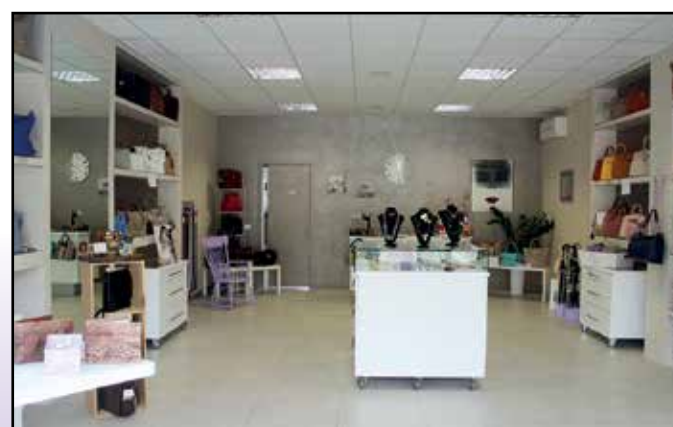
Il negozio di Madame Coco a Montichiari dopo la Farmacia Comunale.