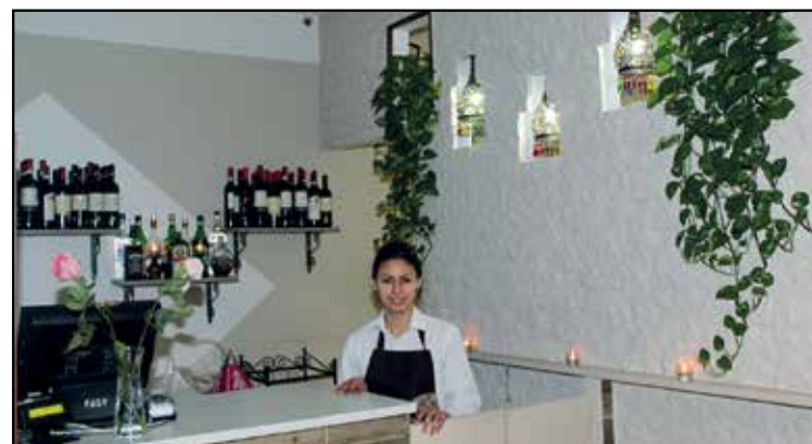
BAR: BIBITE E LIQUORI DELLE MIGLIORI MARCHE - VINO D.O.C.

APERTO da Lunedì a Domenica SOLO SERA 18,30 - 24,00 chiusura cucina ore 23