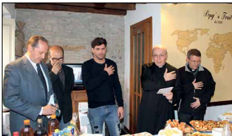
Il momento della preghiera.

La presenza di mons. Fontana per la benedizione accompa-