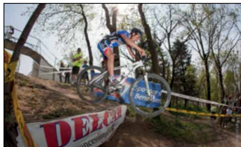
Un passaggio presso il colle di San Pancrazio.