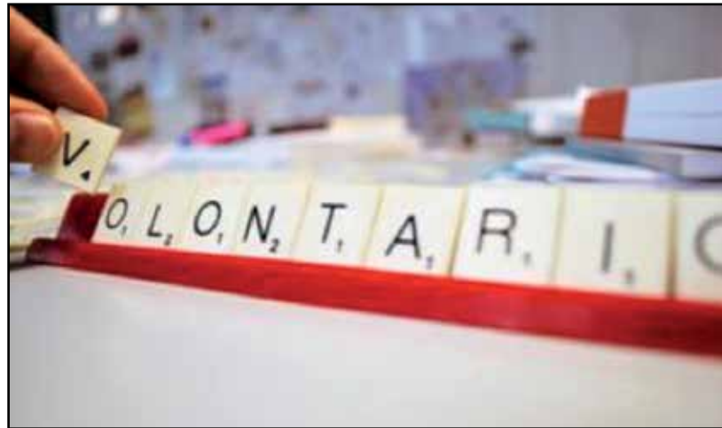
Sei anche tu un volontario?

Abbiamo riaffermato la necessità di valorizzare lo status di volontario e le organizzazioni di volontariato, anche attraverso una più chiara missione attribuita ai Centri di servizio per il volontariato. Molte novità anche sull'impresa sociale. Potranno assumere tale qualifica non solo le cooperative sociali, ma anche le associazioni, le