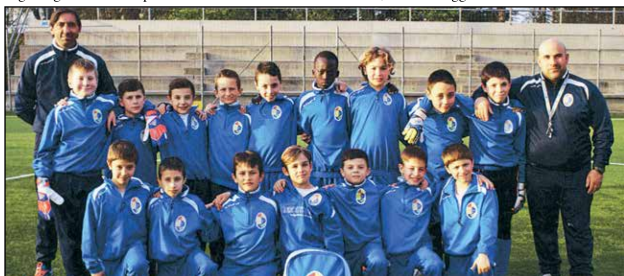
La squadra di calcio Under 10 Gruppo Sportivo Novagli.

Soddisfazione da parte dei genitori e non, con un ringraziamento particolare alla Società ed ai Mister per i risultati raggiunti.